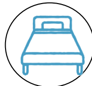
ベッドのお直し (シーツ交換無)