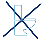
バスルーム・洗面台・トイレの洗浄